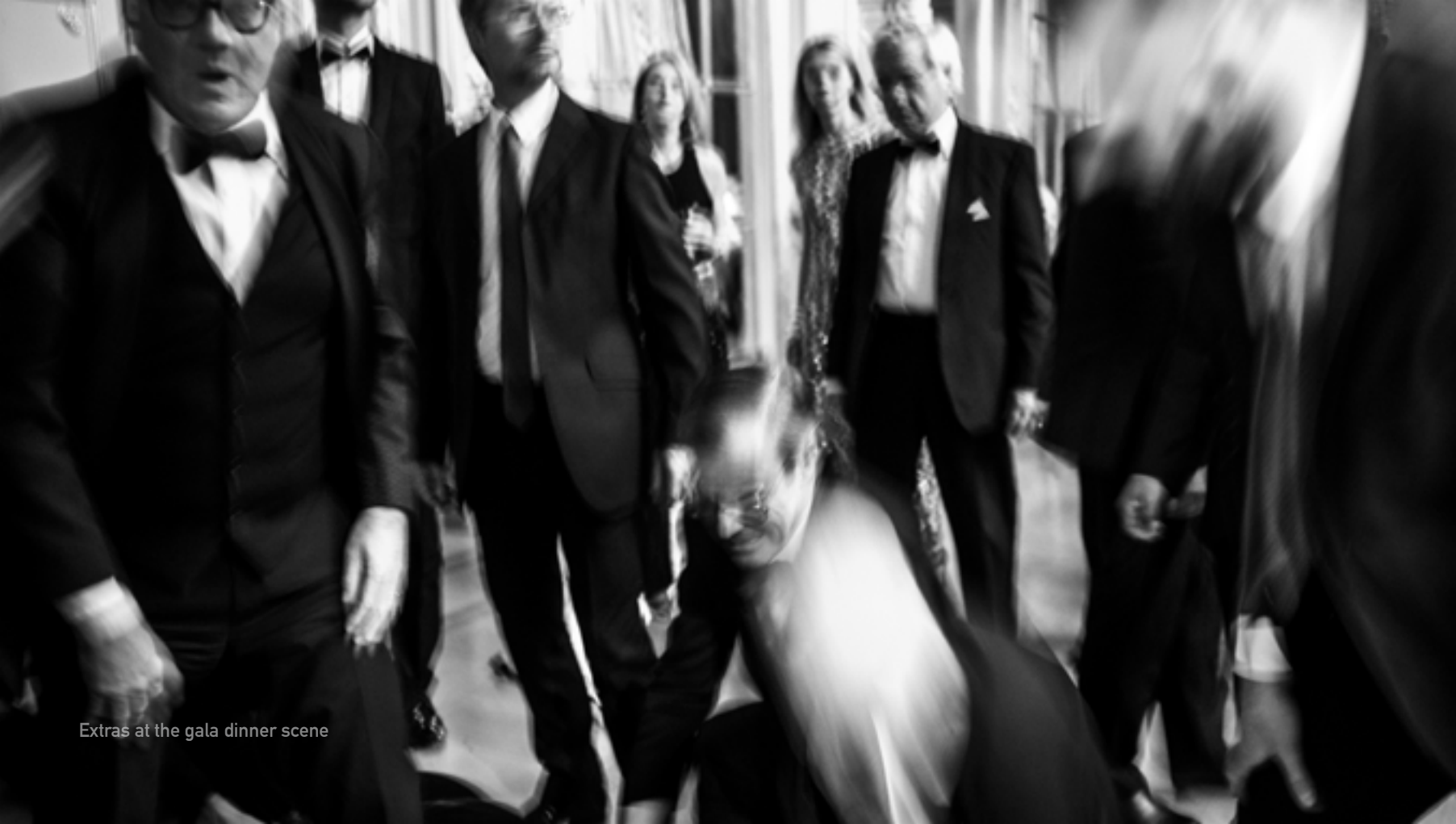
Extras at the gala dinner scene

Director's Note Note d'intention du réalisateur