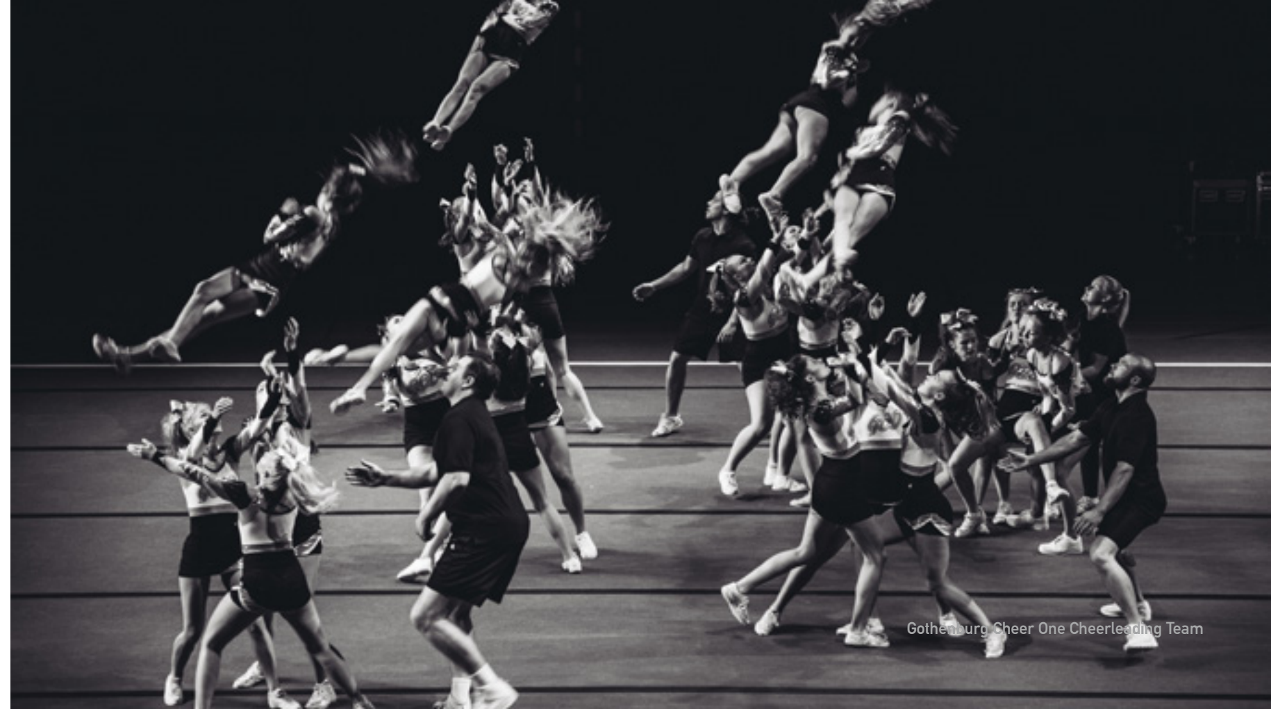
Gothenburg Cheer One Cheerleading Team

Dans THE SQUARE , un jeu d'acteur réaliste et intimiste s'impose. La relation affectueuse entre Christian et ses filles pom-pom girls constitue le cœur émotionnel du film et dénote, par des images concrètes, l'idée d'une quête d'utopie. En effet, les fillettes s'épaulent les unes les autres et font preuve d'un véritable esprit d'équipe, où chacune d'entre elles contribue équitablement à la réussite du groupe. Voir une petite fille de dix ans effectuer un saut périlleux, en comptant sur ses camarades pour la rattraper, est également une manifestation visuelle du rôle de la confiance en l'autre. La concentration et la bonne humeur des pom-pom girls illustrent la meilleure facette de la société américaine, un « esprit d'équipe » résultant de la méfiance des Américains envers l'État, qui sait ?